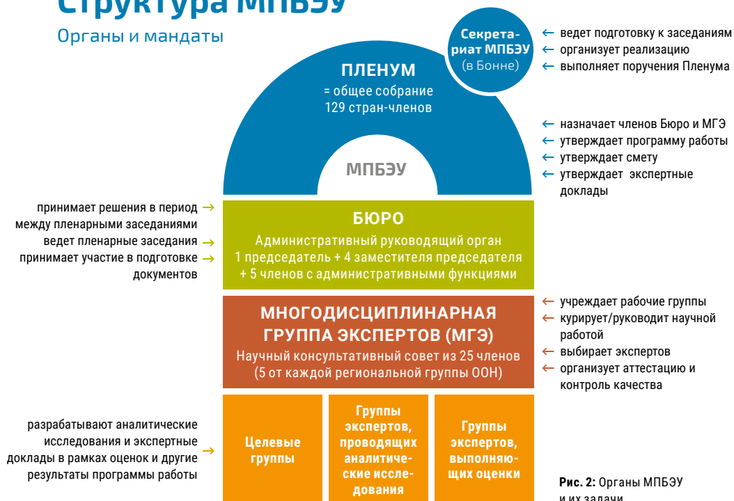
Рис. 2: Органы МПБЭУ и их задачи